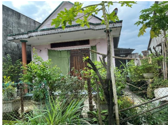
Hình 2. 1: Nhà dân dọc tuyến đường và công trình thoát nước hiện trạng