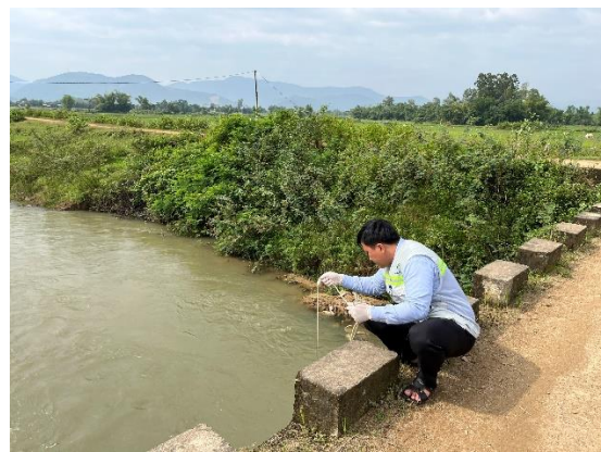
Hình 2. 3: Hình ảnh vị trí lấy mẫu nước mặt