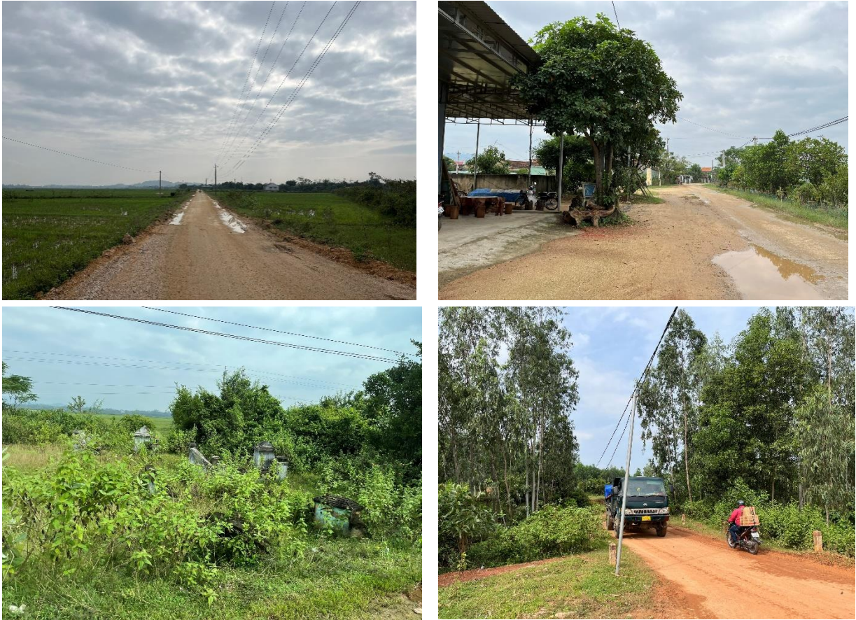
Hình 2. 4: Một số hình ảnh hiện trạng hai bên tuyến đường

Nhìn chung tính đa dạng sinh học của khu vực không cao, trong khu vực không có loài thực vật, động vật đặc hữu hay có nguy cơ tuyệt chủng cần được bảo vệ.