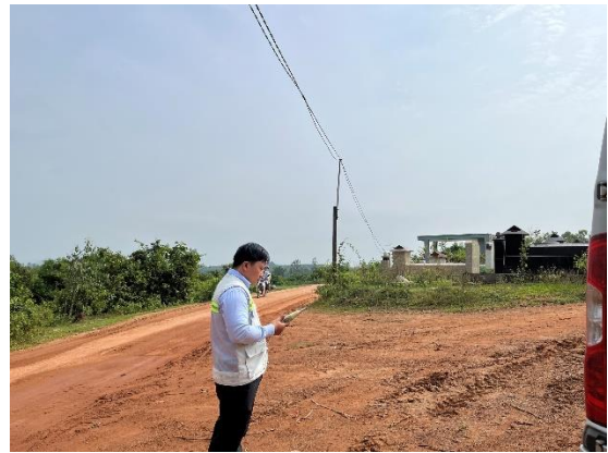
Hình 2. 2: Quan trắc không khí xung quanh ở khu vực thực hiện dự án